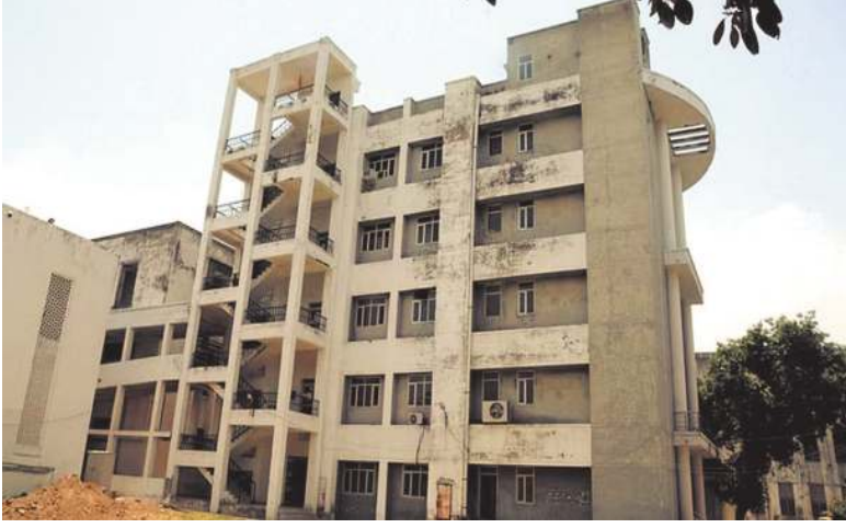
लखनऊ , एजेंसी। प्रदेश के 13 नए (एनएमसी) की टीम निरीक्षण कर चुकी है। मेडिकल कॉलेजों की मान्यता पर इस वर्ष भी इसके बाद भी अभी तक किसी भी कॉलेज संशय है। नेशनल मेडिकल कमीशन को मान्यता नहीं दी गई है। इसके पीछे बड़ी